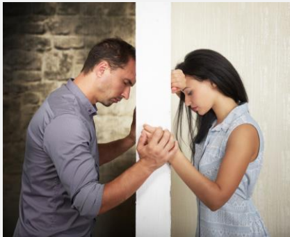
Redet über alles und vergebt!

Ein Lied von David. Er schrieb es, nachdem der Prophet Nathan ihn wegen seines Ehebruchs mit Batseba zurechtgewiesen hatte.