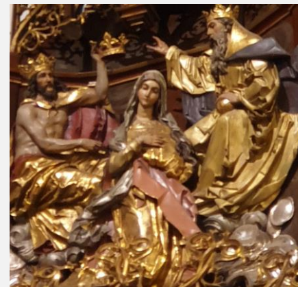
Maria Krönung Altarbild St. Jakobus Hünfeld

Heilige Maria, Du bist die Königin des Himmels und der Erde.