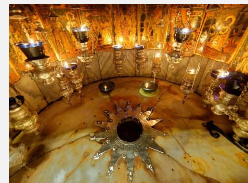
Geburtskirche Jesu in Betlehem