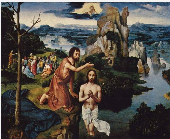
Joachim Patinir Die Taufe Christi

Johannes tadelte auch den Tetrarchen Herodes wegen Herodias, der Frau seines Bruders, und wegen aller Schandtaten, die er verübt hatte. Herodes fügte zu allem noch dies hinzu, dass er Johannes ins Gefängnis werfen ließ.