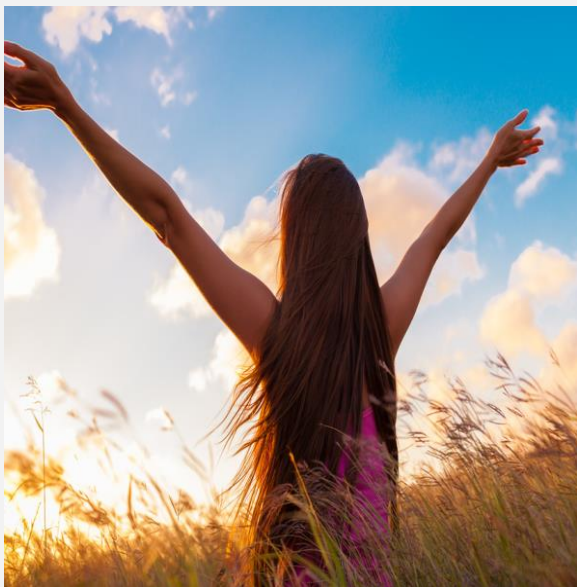
Jesus befreit uns!

Kommt alle zu mir, die ihr euch plagt und schwere Lasten zu tragen habt. Ich werde euch Ruhe verschaffen.